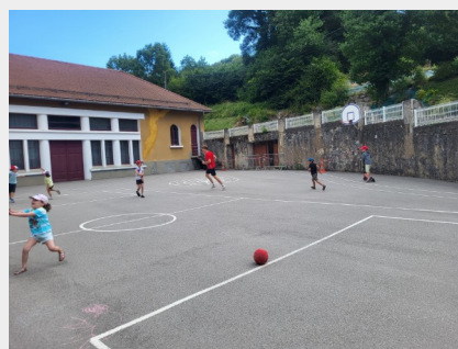
Détente en plein-air (photo 1) – Jeux d'eau (photo 2) – Jeux de plein air (photo 3)